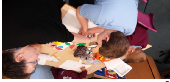
Pomůcky na výklad geometrických objektů

Práce speciálních asistentek je obdobný jako v Čechách. Spočívá ve vysvětlení zadání následně občasnou pomocí a neustálým